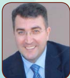
Χριστ. Χριστοδουλίδης Πρόεδρος